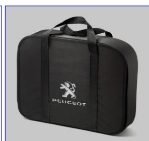
Taška na nabíjacie káble Peugeot 98 493 006 80