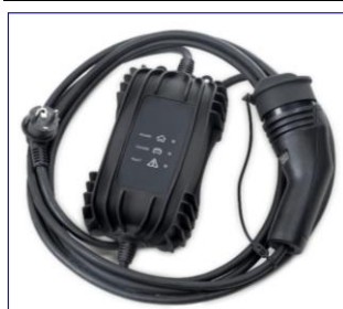
Štandardný kábel pre zapojenie do domácej 230V zásuvky 98 467 444 80